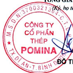
ĐỖ TIẾN SĨ